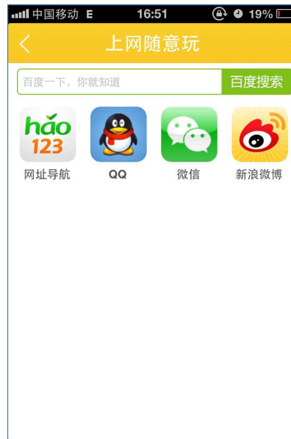
进入上网随意玩，畅想无限网络世界