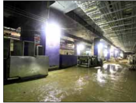
■ 402 - 莲花北车站厅层