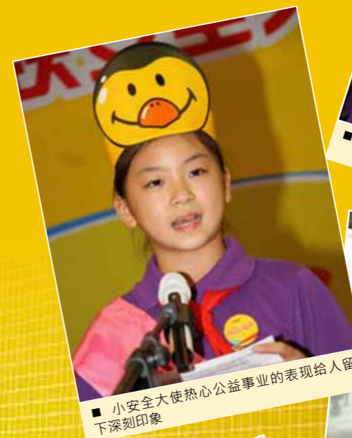
■ 小安全大使热心公益事业的表现给人留下深刻印象