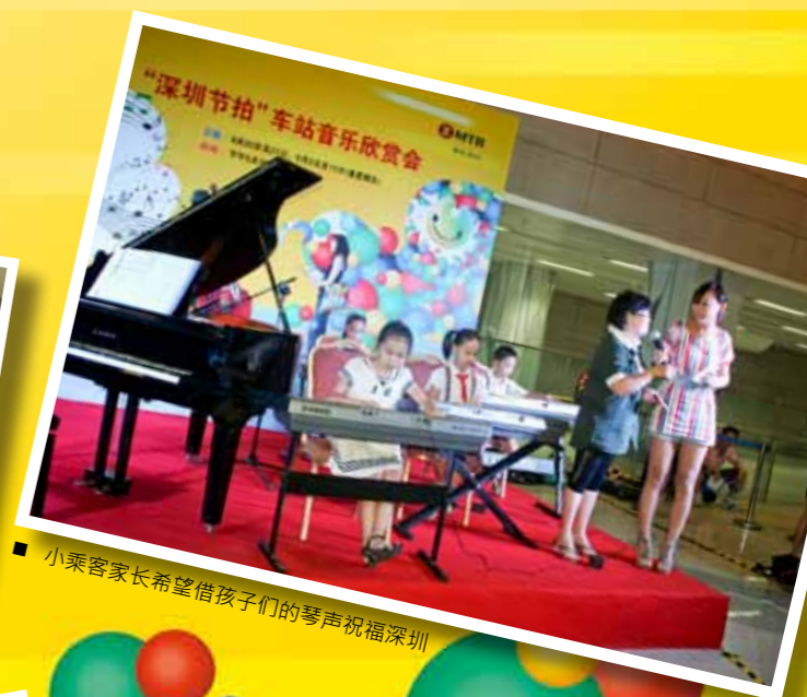
■ 小乘客家长希望借孩子们的琴声祝福深圳