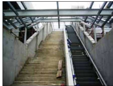
■ 龙胜站电扶梯安装