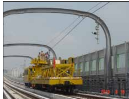
■ 上塘 - 红山 固定接触网馈线