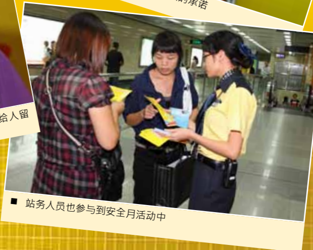
■ 站务人员也参与到安全月活动中