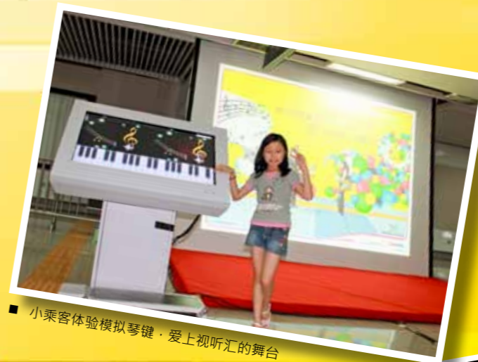
■ 小乘客体验模拟琴键，爱上视听汇的舞台

此外，为庆祝迎接世界大运会倒计时一周年，龙华线市民中心站将迎来“迎大运大变身”，站厅、通道、立柱等将因为海报、灯箱、墙贴、吊旗等一系列软性包装而充满世界大运会的欢乐、轻松信息与元素。