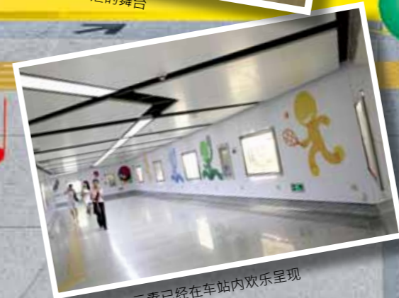
■ “大运”元素已经在车站内欢乐呈现