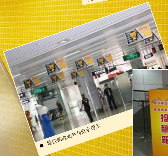
■ 地铁站内处处有安全提示