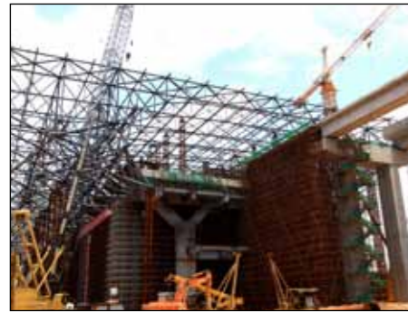
■ 403 - 深圳北车站台层结构及国铁屋盖施工