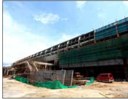
■ 403 - 白石龙站 B、C 出入口施工