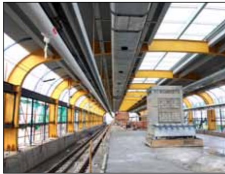
■ 404 - 龙胜站台层