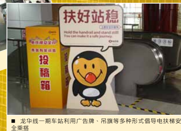
■ 龙华线一期车站利用广告牌、吊旗等多种形式倡导电扶梯安全乘搭