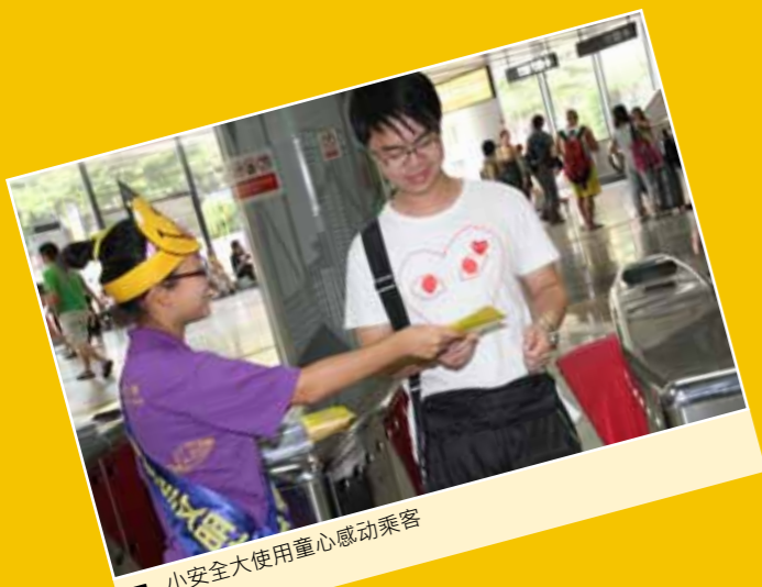
■ 小安全大使用童心感动乘客

9月19日下午，“地铁安全文明月”启动仪式暨“地铁安全文明大使”授勋典礼在福田口岸站举行。此次仪式不仅对前期“地铁安全进校园”主题系列活动选拔出的“地铁安全文明大使”进行授勋，也标志着港铁（深圳）公司地铁安全文明宣传月活动正式拉开序幕。