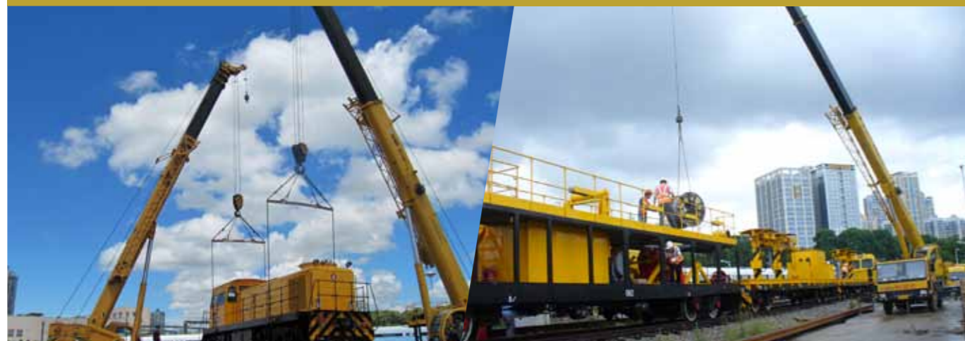
■ 吊机将机车从物流货车上卸到轨道上