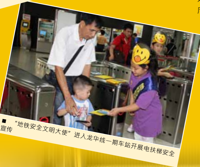
■ “地铁安全文明大使”进入龙华线一期车站开展电扶梯安全宣传