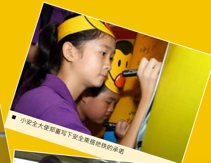
■ 小安全大使郑重写下安全乘搭地铁的承诺